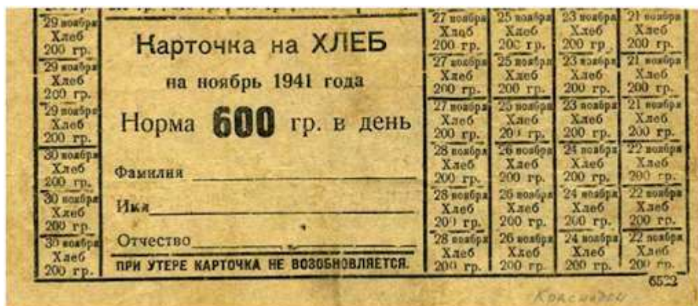
Карточка на хлеб

Накануне войны из 194,1 млн человек населения страны 131 млн (65%) составляли сельские жители. На оккупированной территории оказалось до половины всех существовавших в стране колхозов, совхозов и машинно-тракторных станций (МТС). Ранее здесь производилось до трети зерновых культур и до половины технических культур, большая часть сахарной свёклы и до половины крупного рогатого скота и свиней. Количество комбайнов, тракторов и автомашин составило 60% от довоенного уровня, из МТС было изъято до 90% автомобилей. Из-за значительных потерь возникла необходимость ужесточить административный контроль и повысить требования к количеству обязательно обрабатываемых колхозниками трудодней. Эта норма распространялась и на подростков в возрасте 12–16 лет. Нарушители получали взыскания вплоть до судебного преследования и обязательных исправительно-трудовых работ.