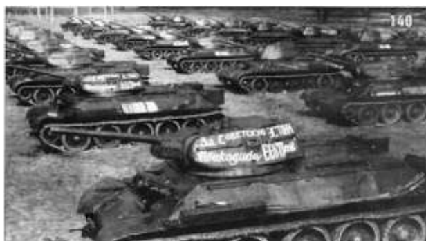
Передача танковой колонны «За Советскую Эстонию» 221-му отдельному танковому полку. 6 мая 1943 г.

В 1943–1945 гг. начинает складываться экономическое превосходство Советского Союза над фашистской Германией в сфере производства всех видов вооружений. В строй было введено более 7,5 тыс. предприятий, многие из которых были построены с нуля, практически на пустом месте. Рост военного производства по сравнению с предыдущим периодом составил 38%. Всего в 1933 г. было выпущено более 24 тыс. танков, 30 тыс. самолётов, 130 тыс. артиллерийских орудий и миномётов. Постоянно модернизировалась техника, создавались и внедрялись в производство новые образцы вооружения. В 1944–1945 гг. объём выпуска военной продукции превысил довоенный уровень в три раза, что позволило обеспечить полное военное превосходство над Германией и её союзниками. В связи с этим следует отметить деятельность наркома танковой промышленности Вячеслава Александровича Малышева (1902–1957), наркома вооружений Дмитрия Фёдоровича Устинова (1908–1984), наркома химической промышленности Михаила Георгиевича Первухина (1904–1978), наркома авиации Алексея Ивановича Шарухина (1904–1975), которые возглавили ключевые отрасли вооружения.