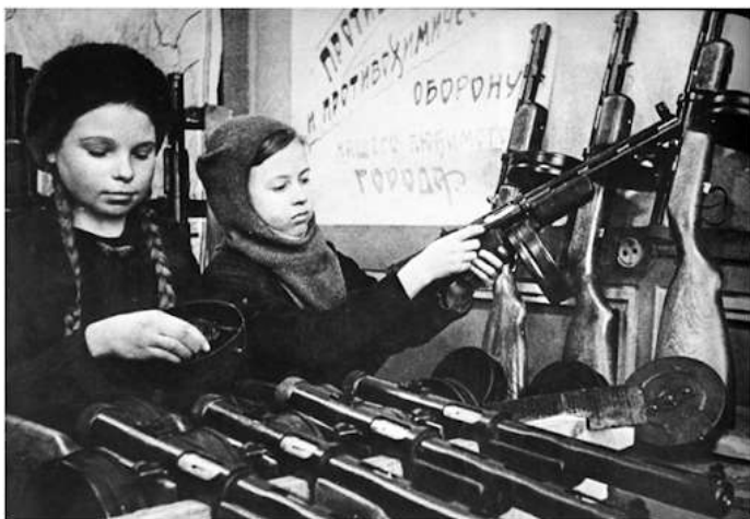
Подростки на военном заводе